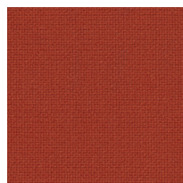
ファブリック ヴァーミリオン