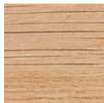
オーク ナチュラルホワイト