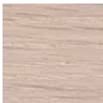
オーク スノーホワイト