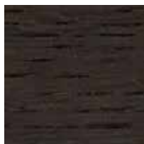
オーク チャコールグレー