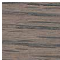
オーク ミディアムグレー