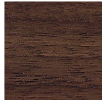
ウォールナット ビーズワックス