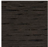
オーク チャコールグレー