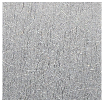
ステンレス パイプレーション