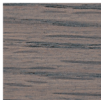
オーク ミディアムグレー