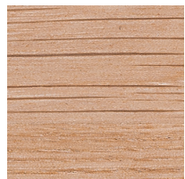
オーク ナチュラルホワイト