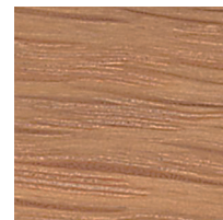
オーク ビーズワックス