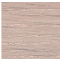
オーク スノーホワイト