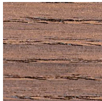
ホワイトアッシュ 耐朽処理